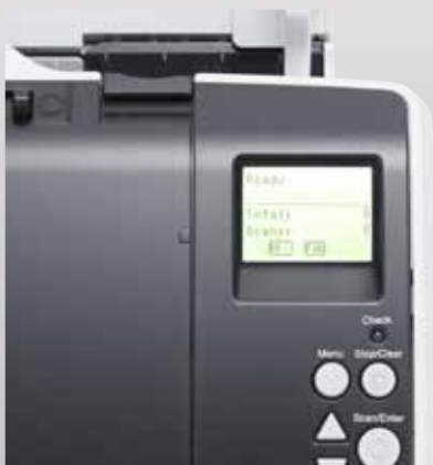
LCD-Bedienfeld mit integrierter Hintergrundbeleuchtung

Ein LCD-Bedienfeld mit Hintergrundbeleuchtung zeigt Informationen wie aktuelle Scannereinstellungen, Betriebsstatus sowie einen Blattzähler. Das Auswählen vordefinierter Routine-Scanvorgänge – die mit der integrierten, leistungsstarken PaperStream Capture-Lösung erstellt wurden – ist kinderleicht.