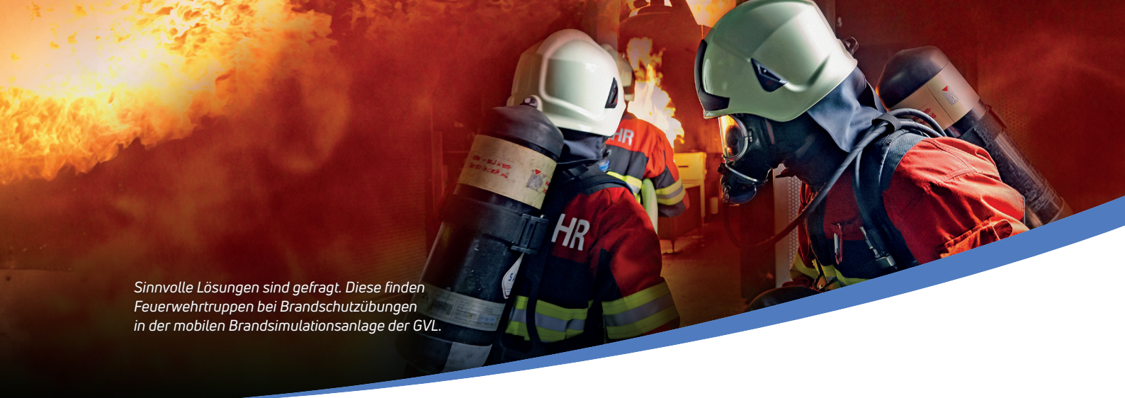
Sinnvolle Lösungen sind gefragt. Diese finden Feuerwehrtruppen bei Brandschutzübungen in der mobilen Brandsimulationsanlage der GVL.